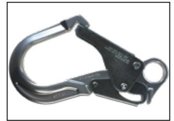
IKV 55 (EN 362:2004-T)